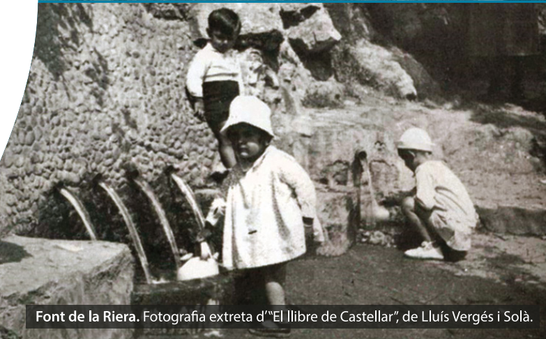
Font de la Riera. Fotografia extreta d'"El llibre de Castellar", de Lluís Vergés i Solà.